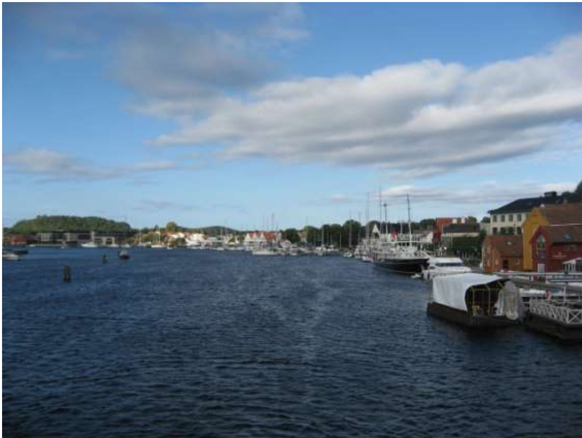
Mandal Gjestehavn fotografert før ny bro og samme dag som solen skinte i 2011 ☺