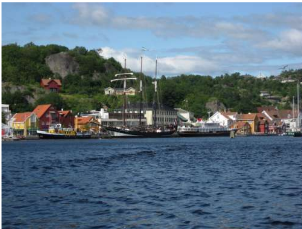
Hyggelig havnebesøk i sommerbyen Mandal 2011

Havnestyret anbefales å ta rapport om gjestehavndrift 2011 til orientering.